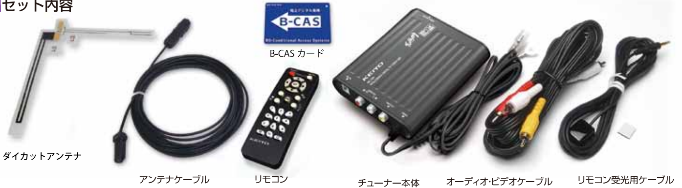
ダイカットアンテナ