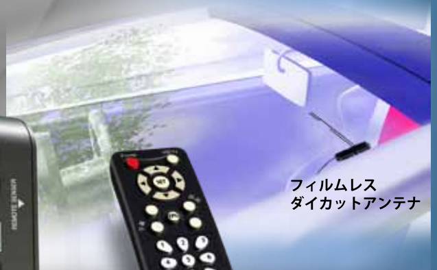
フィルムレス ダイカットアンテナ