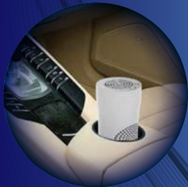
車載対応で車内の空気を浄化します。