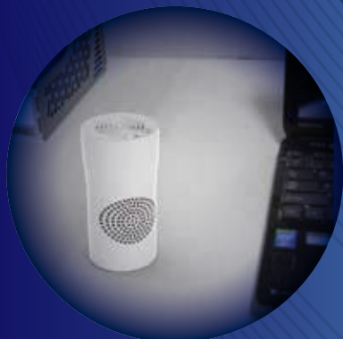
USB接続だからオフィスのデスク上の省スペースで使用できます。